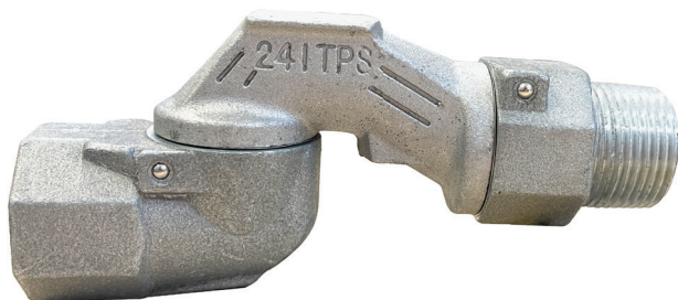
CONEXÃO GIRATÓRIA ALUMÍNIO 3/4" NPT TIPO "Z" Código: 1764